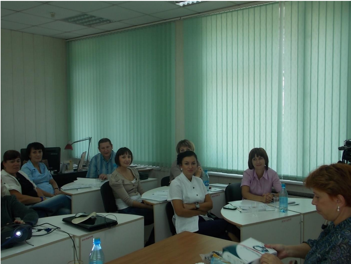
Тематическое усовершенствование с врачами поликлиники

Активно развивается социальное партнерство. В 2013 году учреждение заняло третье место в краевом смотре-конкурсе «За высокую социальную эффективность и развитие социального партнерства». В 2017 году КГАУЗ «Канская МСП» заняло первое место в краевом смотре-конкурсе как «Лучшая организация Красноярского края по организации работы в области охраны труда».