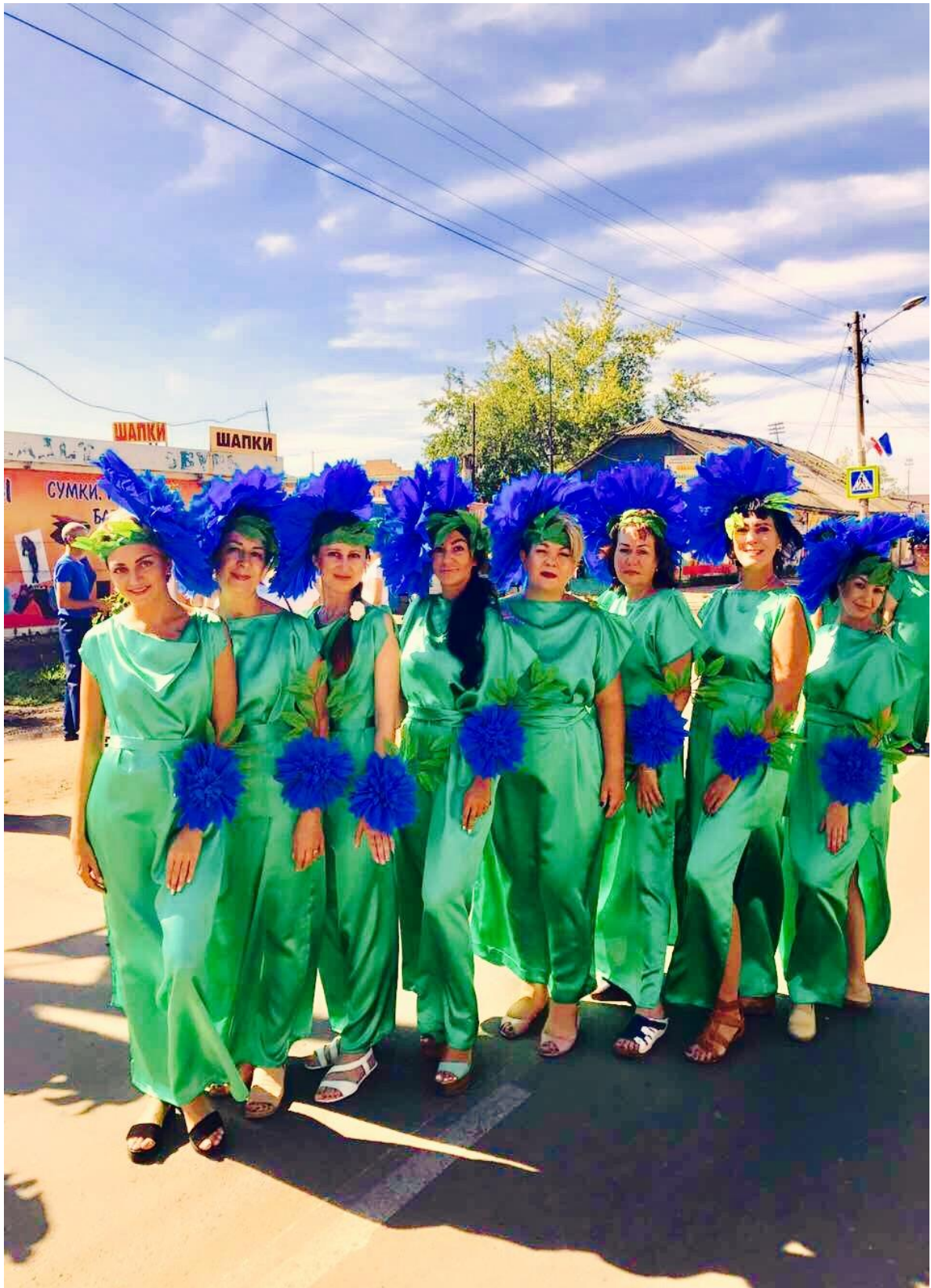
Коллектив на Дне города в 2017 году