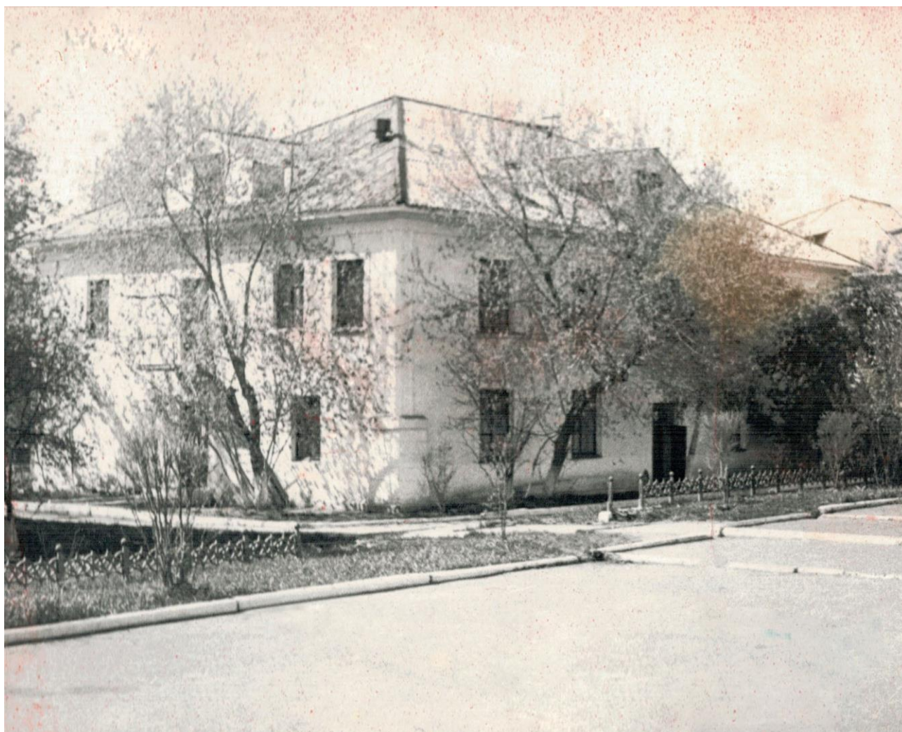
Здание стоматологической поликлиники по улице Ленина, 6 (ныне-ортопедическое отделение КГАУЗ «Канская МСП»)

В структуре открывшейся поликлиники-- терапевтическое, детское, ортопедическое отделения, регистратура, физио-, рентгенкабинет. Окончательно формируется работоспособный, инициативный, профессиональный коллектив, появляется новое оборудование, внедряются новые методы лечения и диагностики.