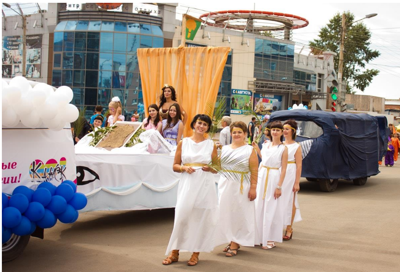
Колонна поликлиники на юбилее города в 2016 году

В поликлинике бережно сохраняют традиции наставничества, активного участия в городских праздниках, совместного празднования знаменательных дат.