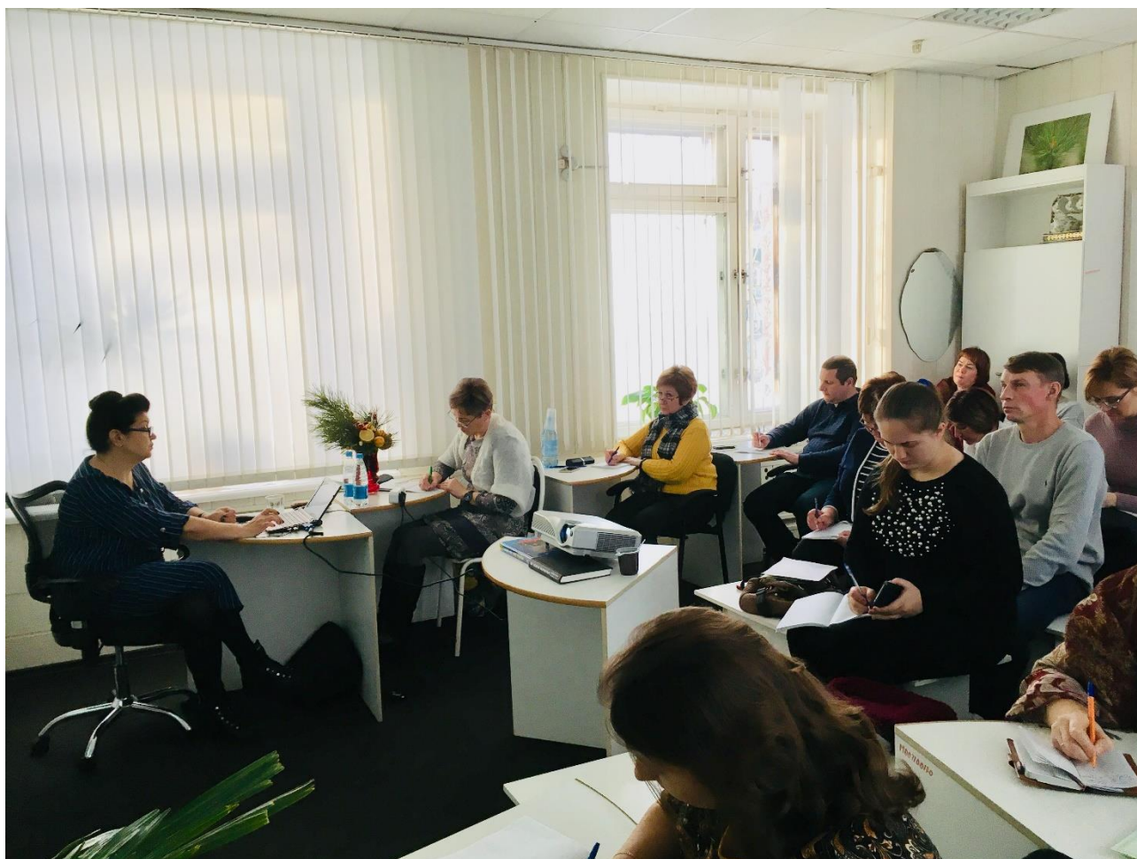
Общее усовершенствование с врачами поликлиники

Ежегодно поликлинику посещает более 80-ти тысяч взрослых и детей. Высококвалифицированный и профессиональный коллектив учреждения ежедневно оказывает все виды стоматологической помощи с применением современных диагностических, терапевтических, хирургических, ортодонтических и ортопедических технологий, повышает уровень своего образования непрерывно, в том числе в ходе циклов усовершенствования, проходящих в стенах учреждения.