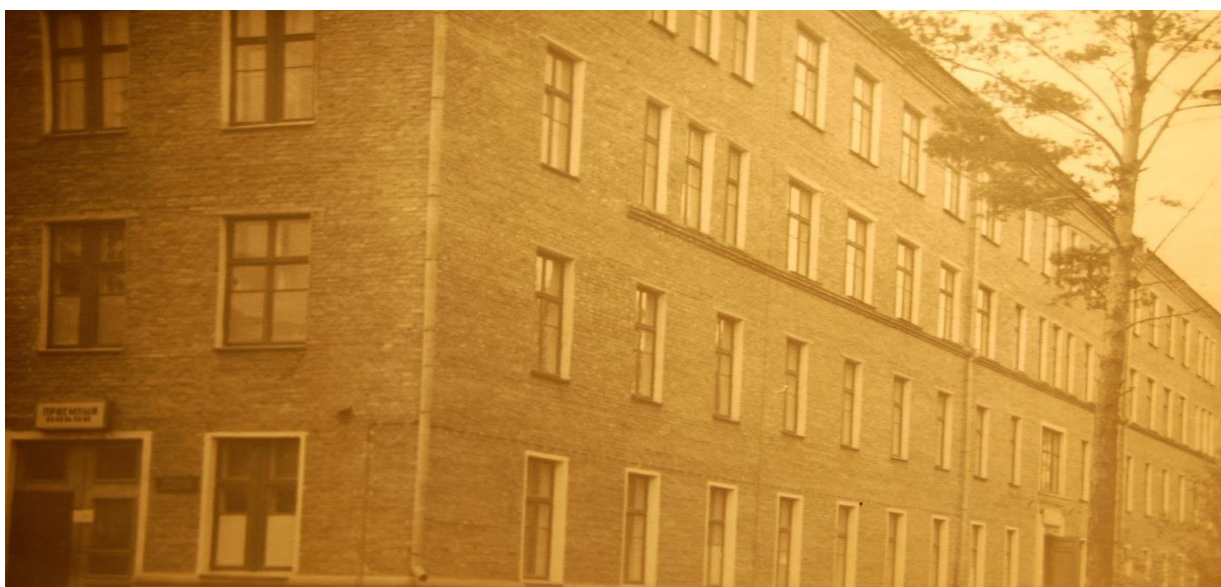
Здание больнично-поликлинического объединения №3 (Больница №3) 1964 год.

В мае 1964 года проведено объединение хирургической службы города. Все должности хирургов были объединены и переданы больнично-поликлиническому объединению № 3, на базе которого были сосредоточены все хирургические койки.