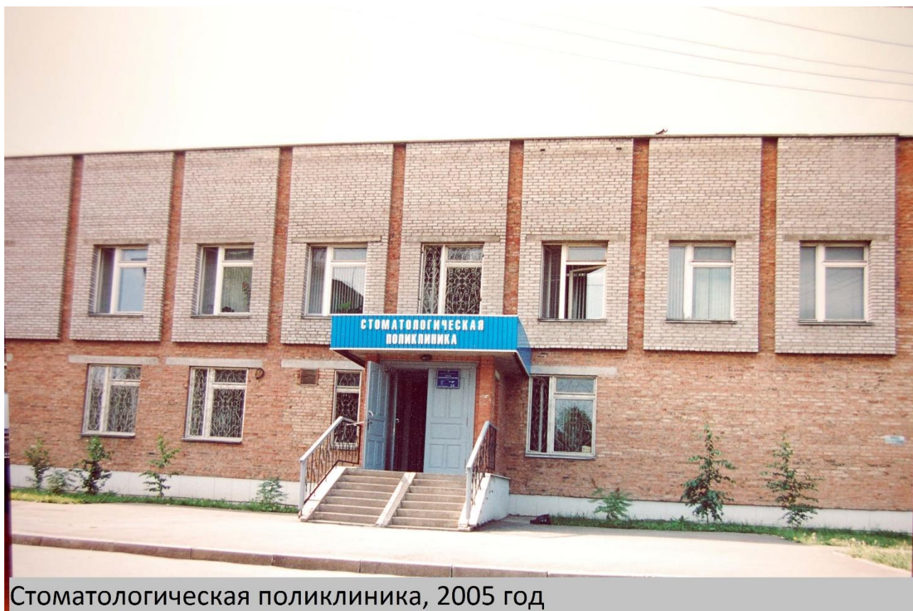
Стоматологическая поликлиника, 2005 год

Расходы по достройке и ремонту здания взял на себя городской бюджет, а необходимое для оснащения оборудование было закуплено на средства краевого бюджета. В 2001 году новое здание взрослого стоматологического отделения было готово для ввода в эксплуатацию.